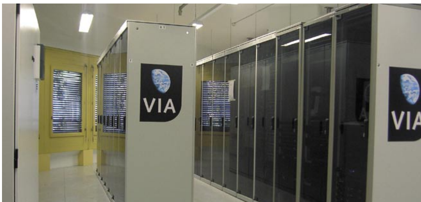
World Class Data Center in Zürich und Shanghai gewährleisten den sicheren Betrieb von Servern